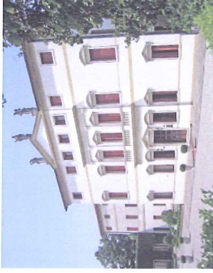
Villa Soranzo Conestabile via Roma 1 Scorzè - Venezia